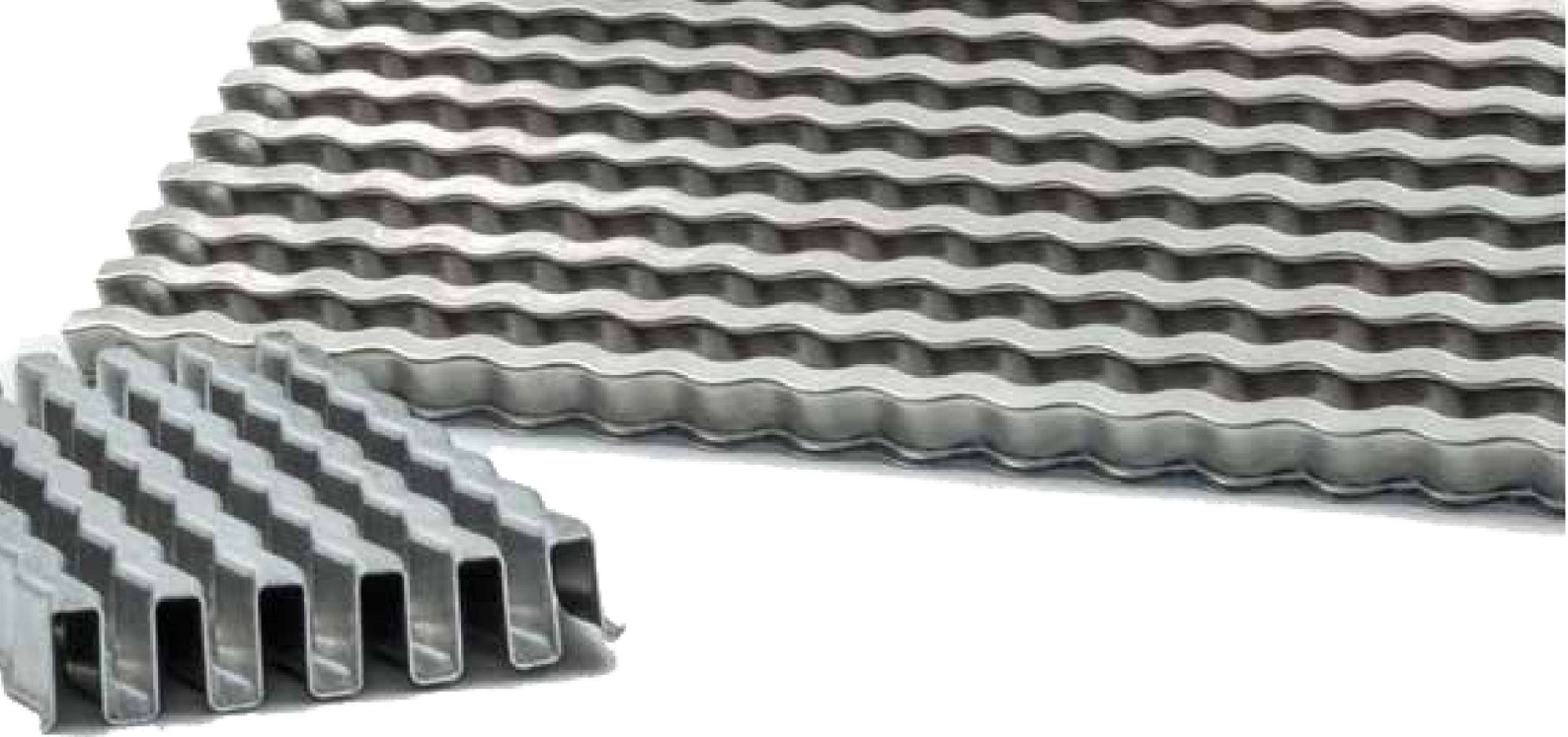
熱交換器用フィン

多くの熱交換器メーカーが、当社の専門知識、経験、そして冷却器のフィンやその他の部品に関するソリューションを高く評価しています。熱交換器の冷却能力はフィンの表面積に依存し、ひいては冷却器の効率を左右します。当社の専門知識を活用いただければ、お客様の具体的なニーズを実現し、競争において優位性を提供することができます。EMD は、ツールに加え、フィン製造ライン一式（ターンキー方式）も提供しています。